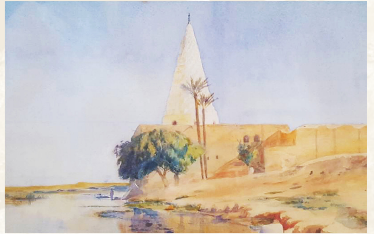
ANDRÉ, Émile, Vue du tombeau de Daniel à Suse . Aquarelle et crayon sur papier, 1899. Coll.part.