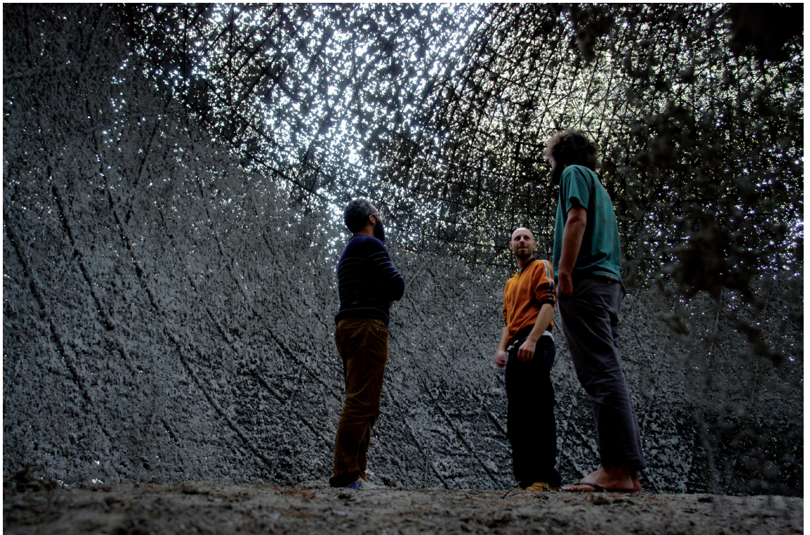
Erratique , 2009 MEN / CAN, Neuchâtel, Suisse