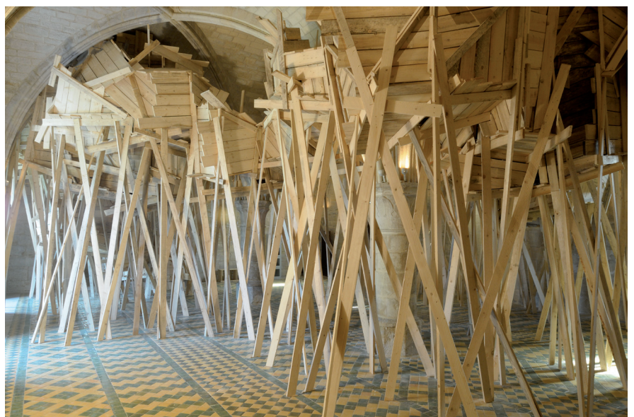
Le buisson maudit , 2013 Abbaye de Maubuisson, Saint-Ouen-l'Aumône