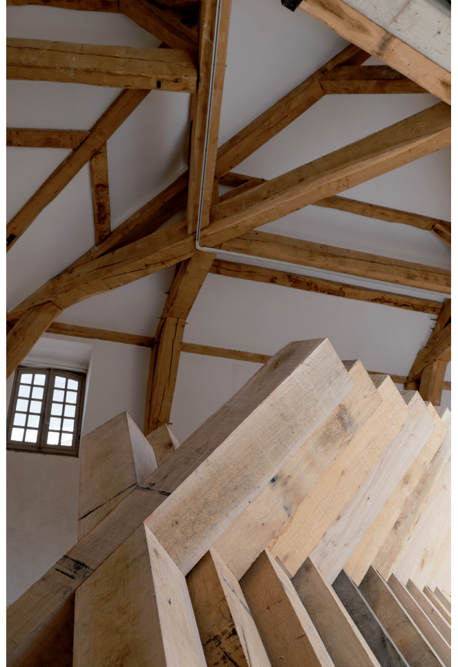
Le culte de l'archipendule , 2014 Vue de l'exposition à La Maréchalerie, centre d'art contemporain de l'énsa-v