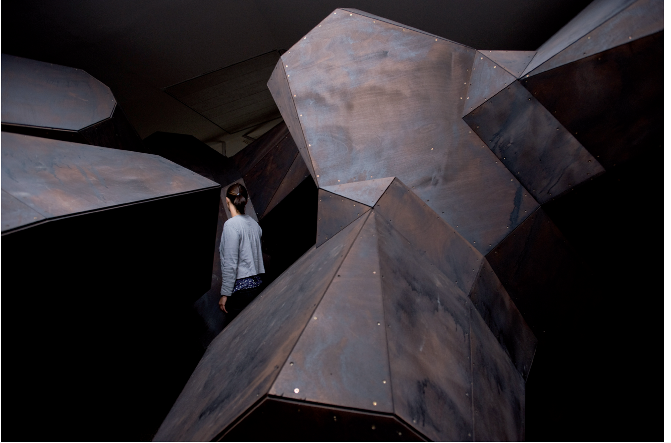
Les éléments , 2011 Centre culturel suisse, Paris