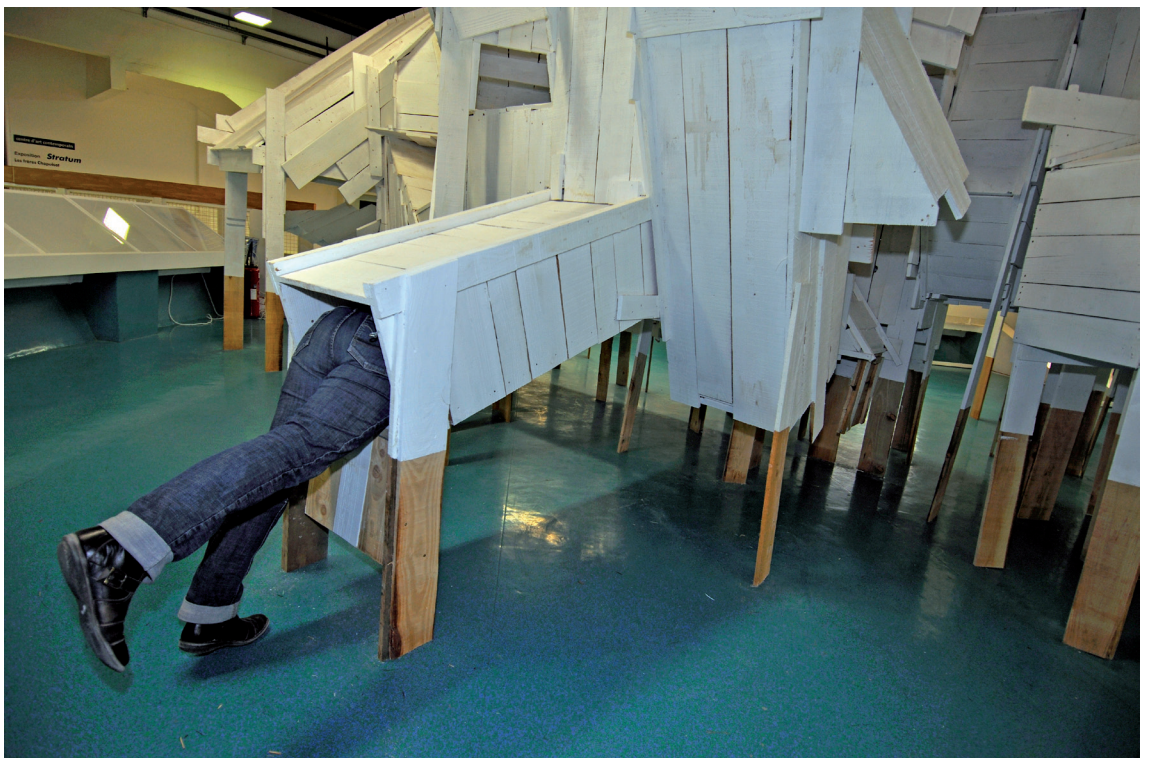
Stratum, 2010 Le Parvis, Tarbes