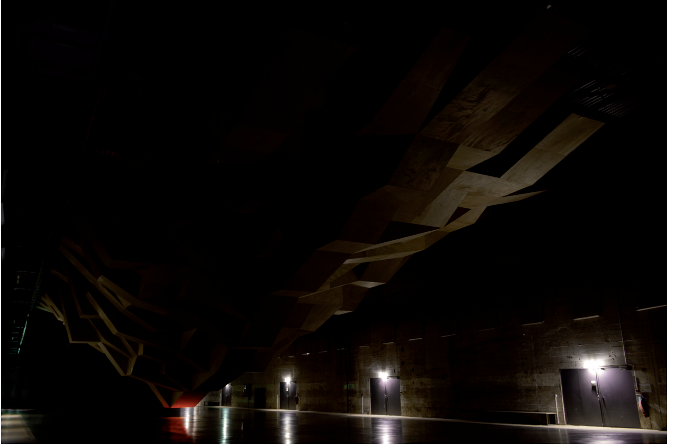
Métamorphose d'impact #2, 2012 Le LIFE / Le Grand Café, Saint-Nazaire