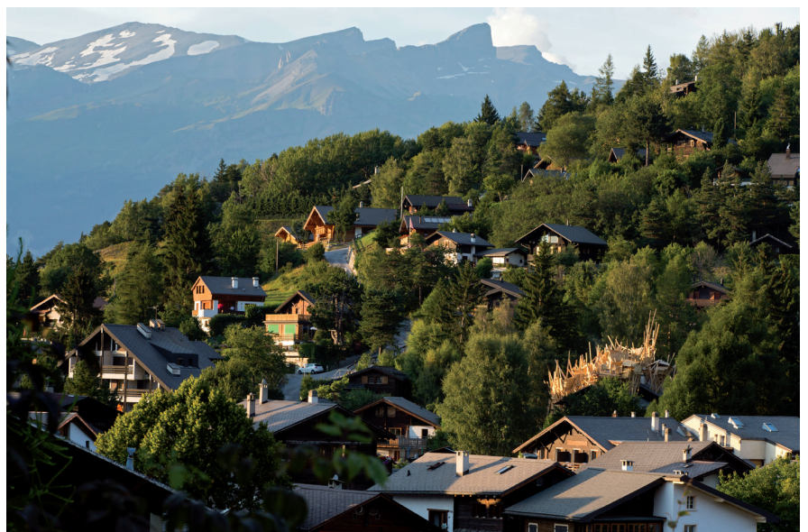
La résidence secondaire, 2012 R-Art, Vercorin, Suisse