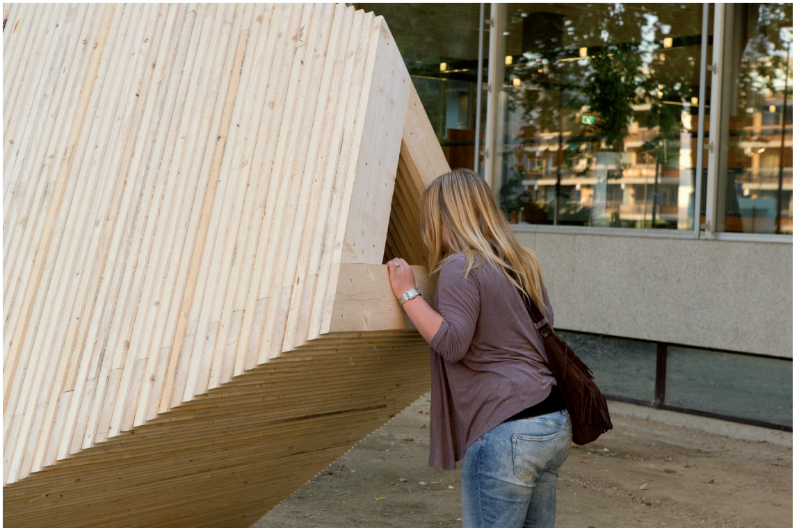
La crypte , 2010 Fundament Foundation. Tilburg. Pays-Bas