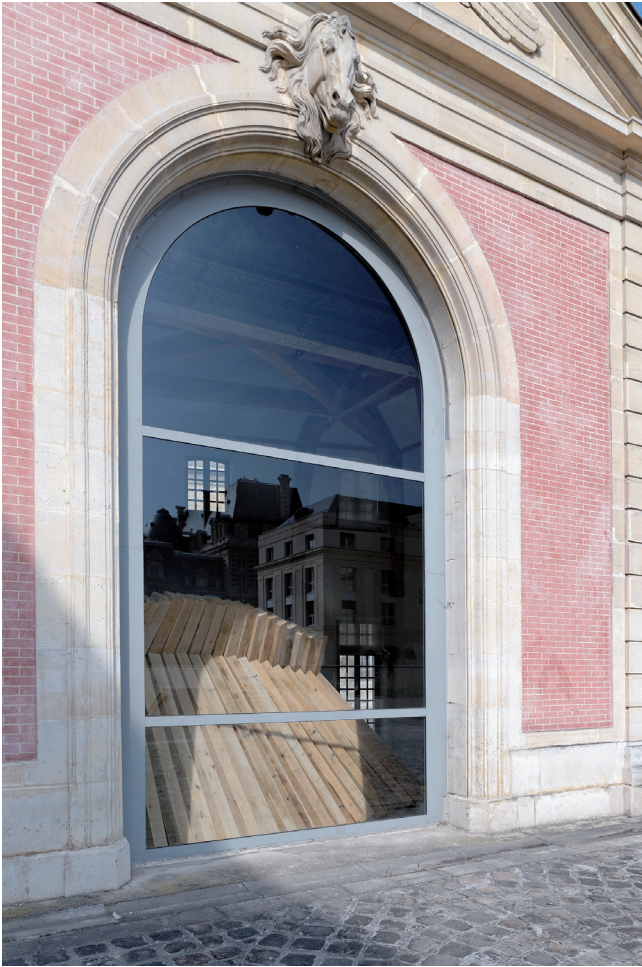
Le culte de l'archipendule , 2014 Vue de l'exposition à La Maréchalerie, centre d'art contemporain de l'énsa-v