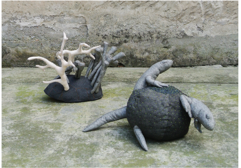
Biotopes - prototype I Lichen-Antlers , 2013 – Feutre, tissu, enduit et sable. 60 x 60 x 50 cm.