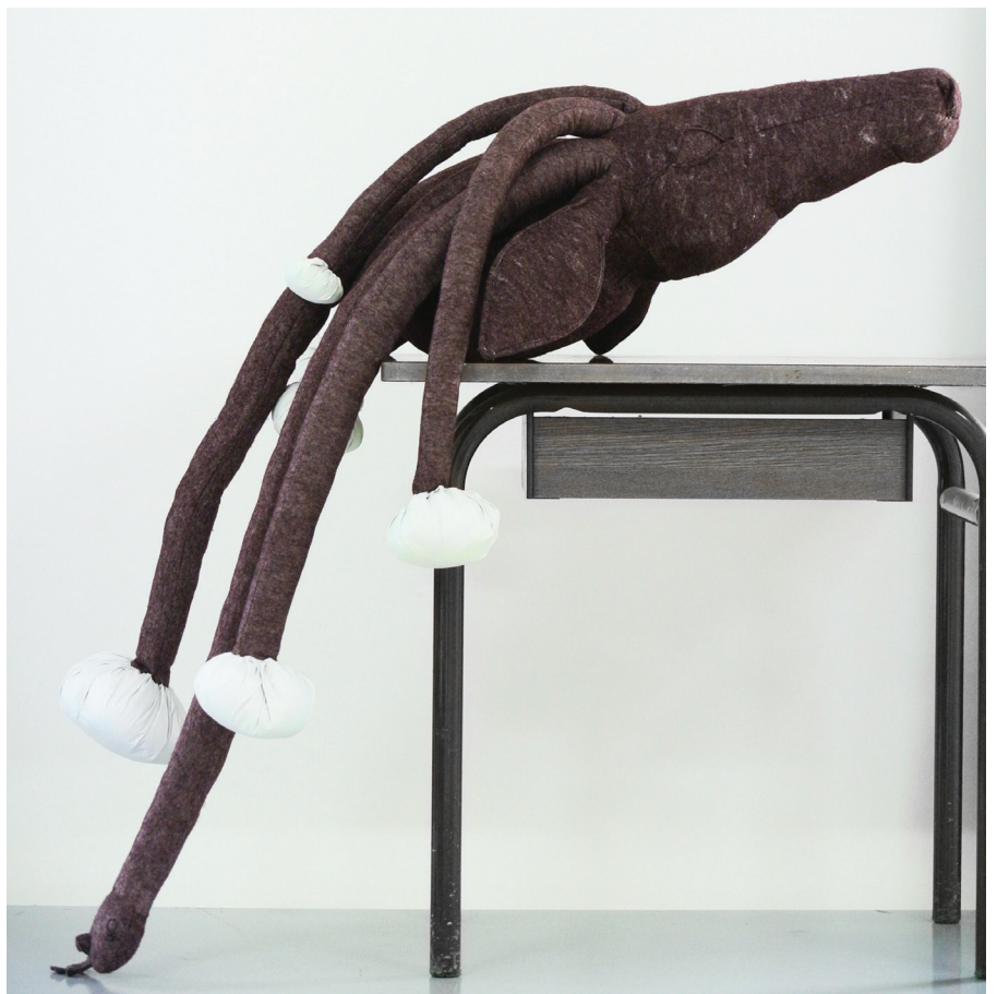
Biotopes - prototype III Deer Head-Mushrooms-Frog , 2013 – Feutre, tissu, enduit et sable. 70 x 50 x 160 cm.

Vue d'atelier.