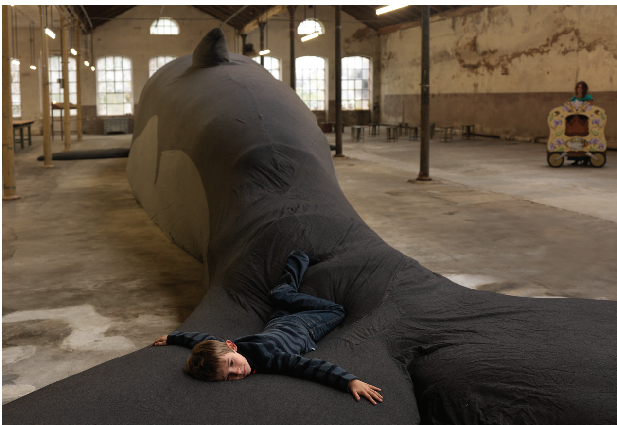
Les Funerailles de la Baleine , 2010 – Laine, rembourrage, chambre à air. 24 x 4 m environ.