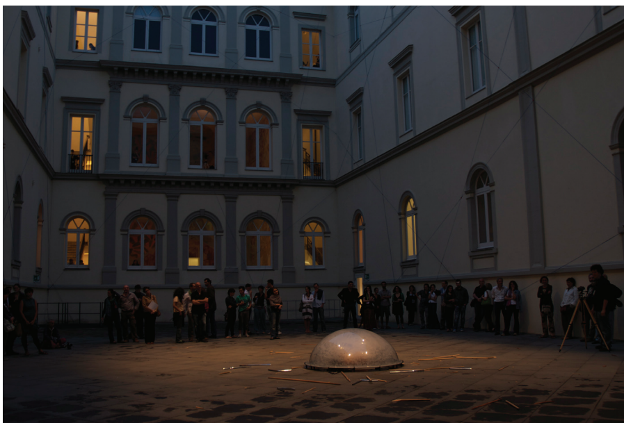
Caparazón (Coquille) , 2010 – Performance. Exposition Corpus - Arte in Azione . MADRE, Musée d'art contemporain Donna Regina. Naples, Italie. Crédits photo : Rafael Burillo, Teresa Margolles, Amedeo Benestante.