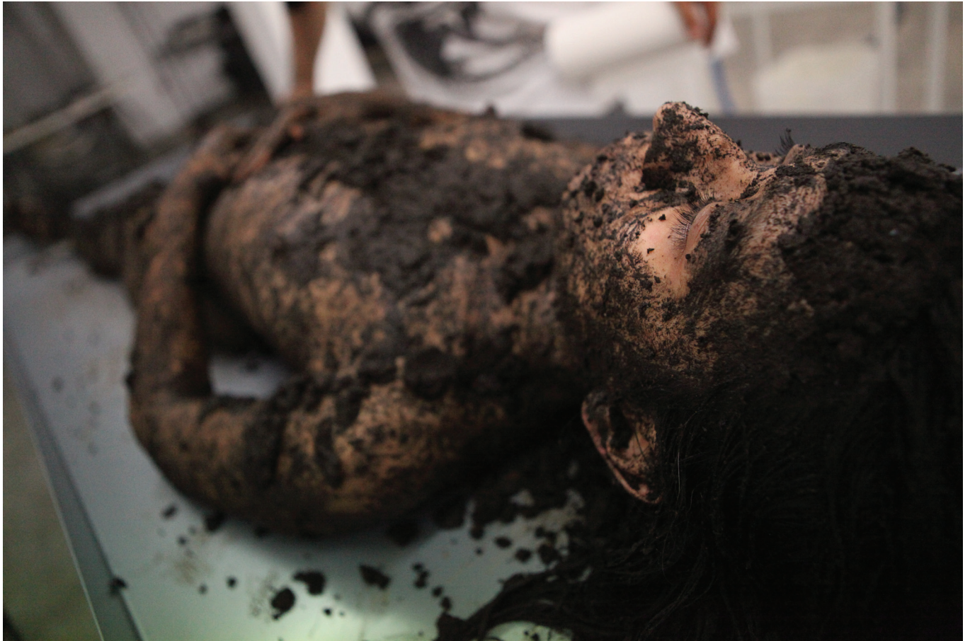
Alud (Avalanche) , 2011 – Performance.

Festival de Performance de Thessalonique, programme en parallèle de la III e Biennale d'art contemporain de Thessalonique, Grèce.