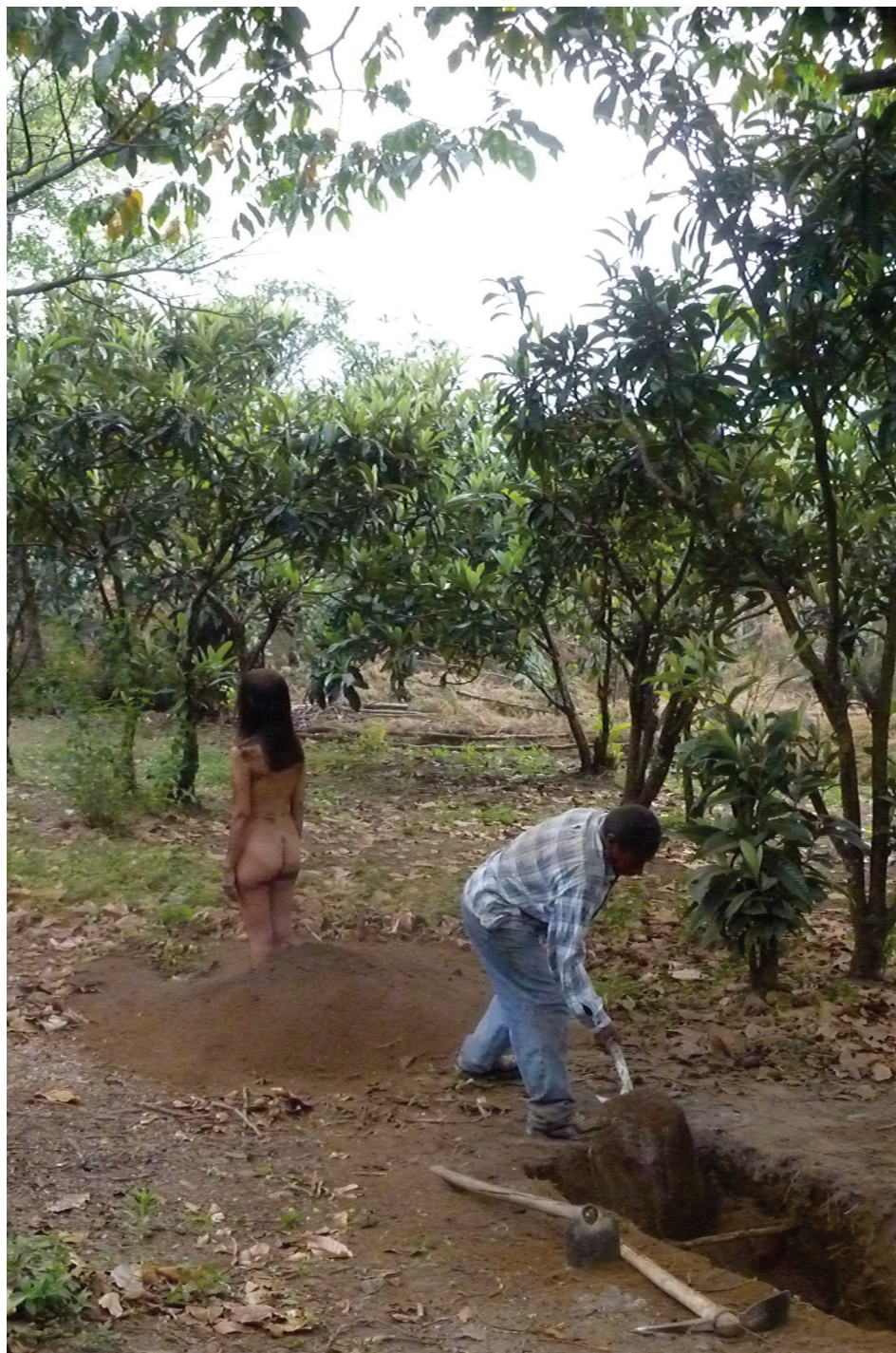
Paisaje (Paysage) , 2012 – Vidéo. 25'24". Performance réalisée à Antigua, Guatemala.