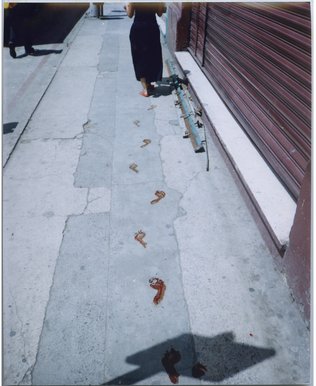
Quién puede borrar las huellas? (Qui peut effacer les traces?) , 2003 – Performance, Guatemala.