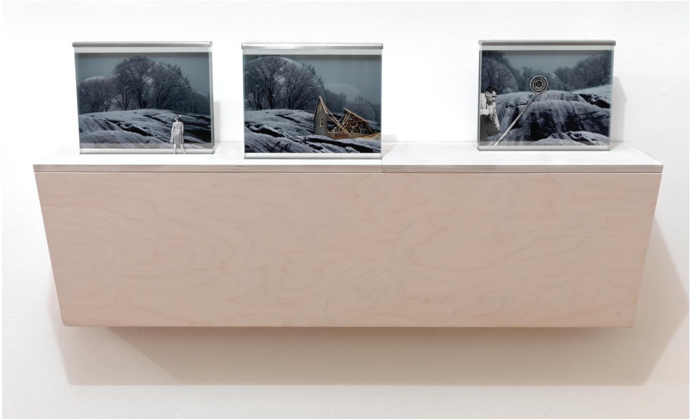
Landscapes (Paysage) , 2010 – Bois, verre, métal et photographies. Socle : 28,5 x 126 x 38,5 cm. Photographie : 25 x 28 x 4,5 cm chaque. Courtesy de l'artiste et Monica De Cardenas Gallery, Milan, Italie. Crédits photo: Dario Lasagni