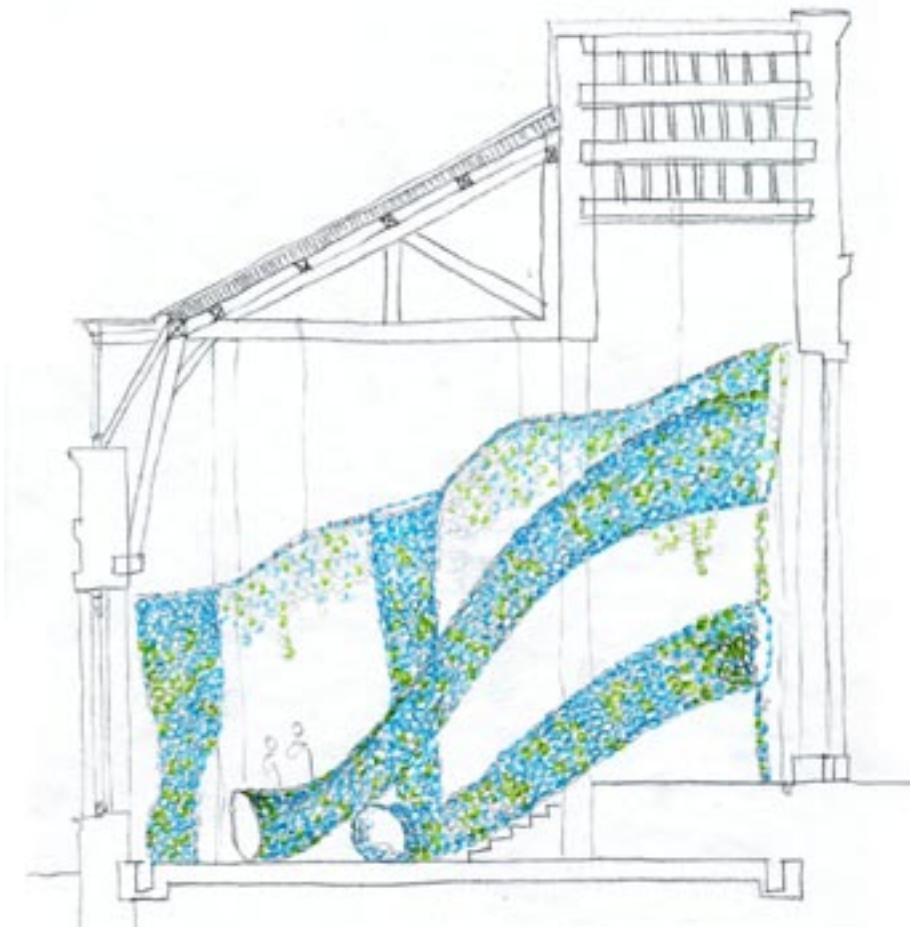
▲ Etude pour Garrafa , Campana, 2009 © Campana