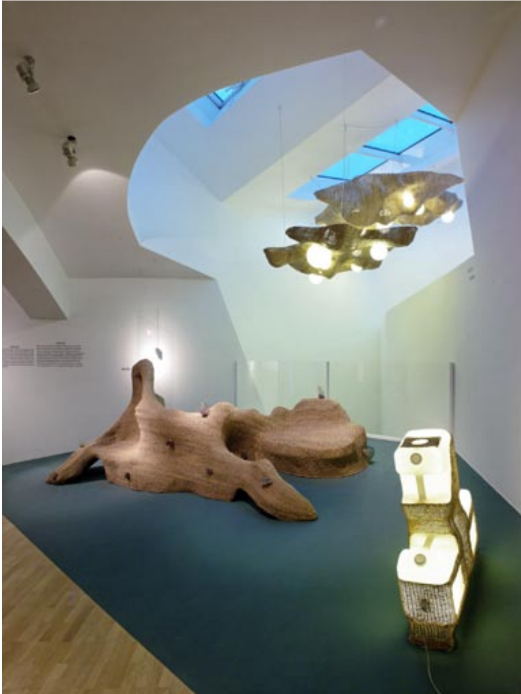
▲ Vue de l'exposition, Vitra Design Museum, 2009