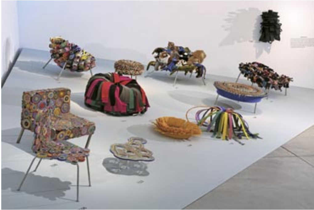
▲ Vue de l'exposition, Vitra Design Museum, 2009 ▼