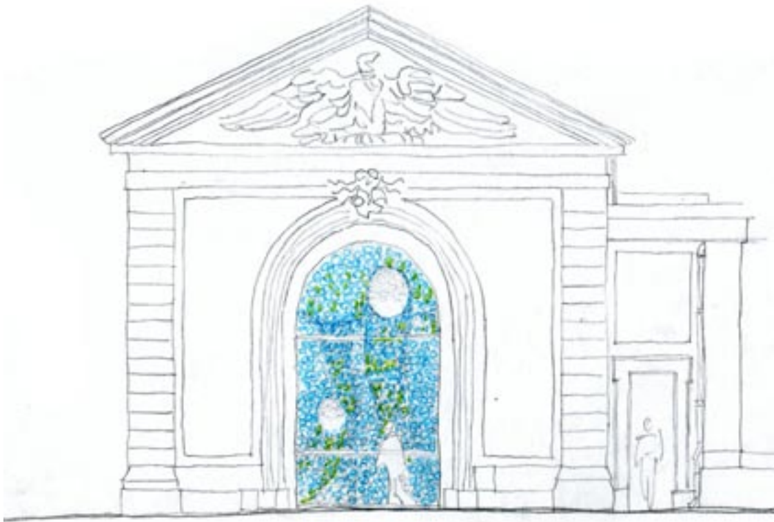
▲ Etude pour Garrafa, Campana, 2009 © Campana