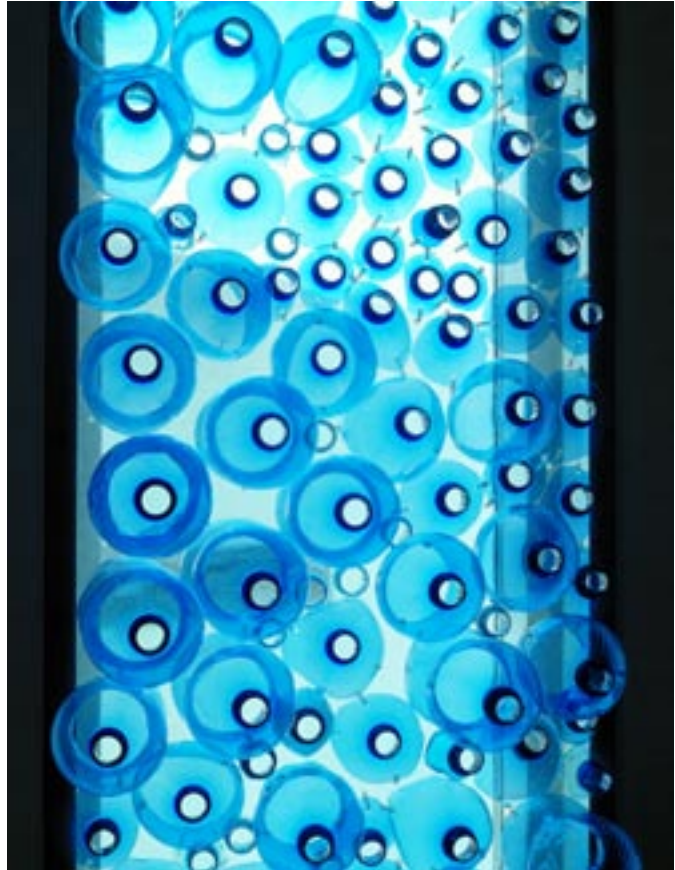
▲ Vue de l'exposition. Vitra Design Museum, 2009

► En ce moment, exposition des frères Campana au Vitra Design Museum ANTICORPS - Travaux de Fernando & Humberto Campana de 1989 à 2009 Vitra Design Museum, Weil am Rhein. Jusqu'au 28/02/2010, www.design-museum.de