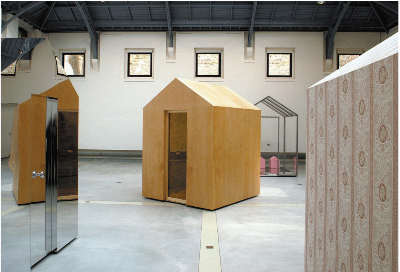
Je serai ton miroir, La Verrière Hermès, Bruxelles, 2002