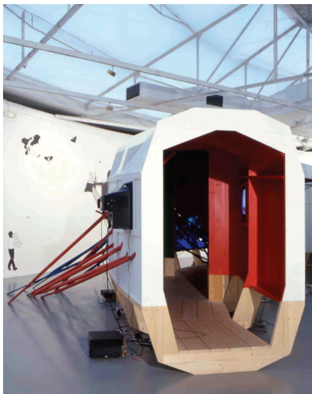
"Toitoitropa", 2001, Musée d'art Moderne de la Ville de Paris, ARC avec Marco Berrettini

ge-démontage, où un simple son guttural ou un claquement de portière de voiture deviennent signifiants, car tout en produisant des effets de sens ces sonorités restent matière sonore plastique, tendent à revenir en quelque sorte à l'en deçà de la signification. Cette dernière tendance est-elle même réalisable ? »