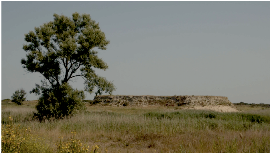
Lande , in Le Film des objets , Frank Smith, 2023.