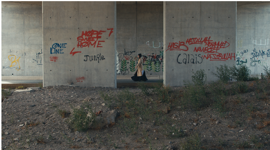
Le Film d'en finir ou pas , Frank Smith, 2023.