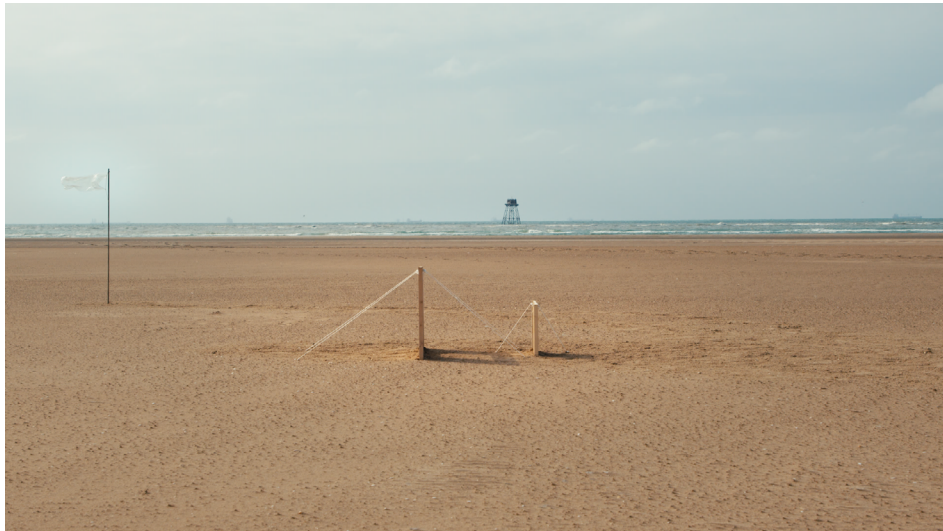
Le Film des objets , Frank Smith, 2023.