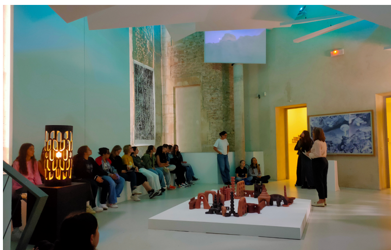
Visite de l'exposition La grotte de l'amitié .

Atelier d'expérimentation artistique : les visites peuvent être prolongées d'un exercice d'expérimentation plastique en lien avec les œuvres exposées et adapté à l'âge des participants. Du lundi au vendredi : 2h, 100€.