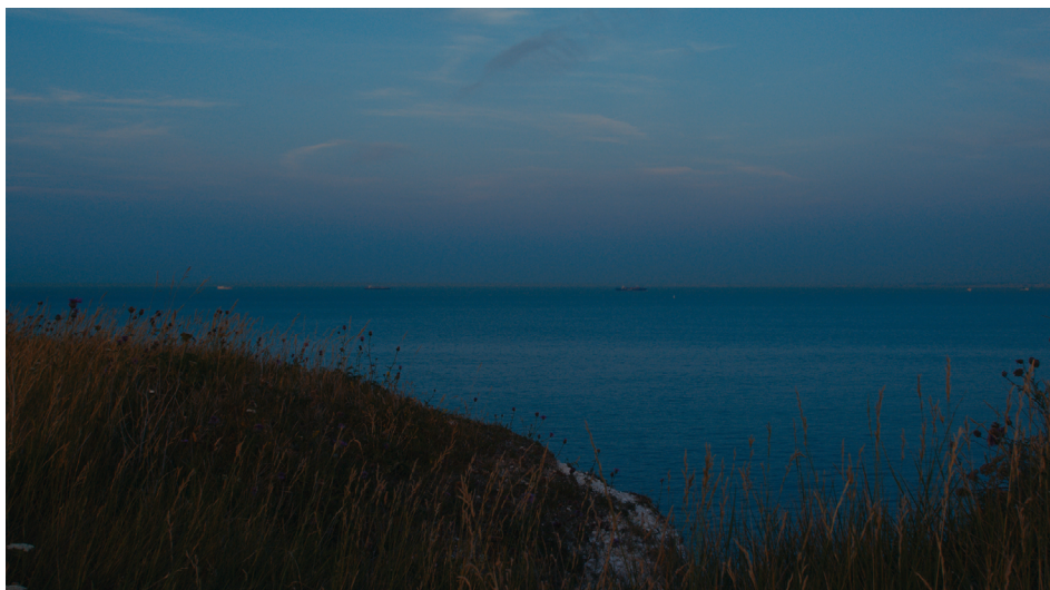
Le Film des 2-mers , Frank Smith, 2023.