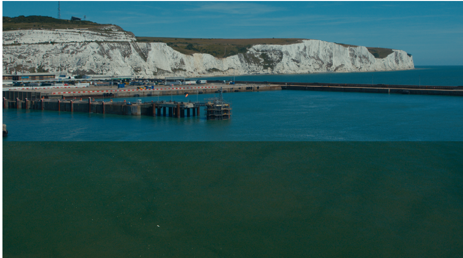
Le Film de la traversée , Frank Smith, 2023.