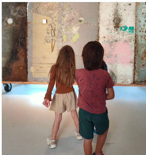
Visite de l'exposition Du béton, de l'acier et de la viande .

inscriptions à lamarechalerie@versailles.archi.fr