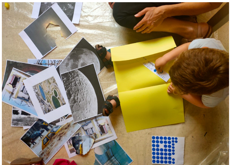
Atelier de l'exposition Matar, Matar, Matar .