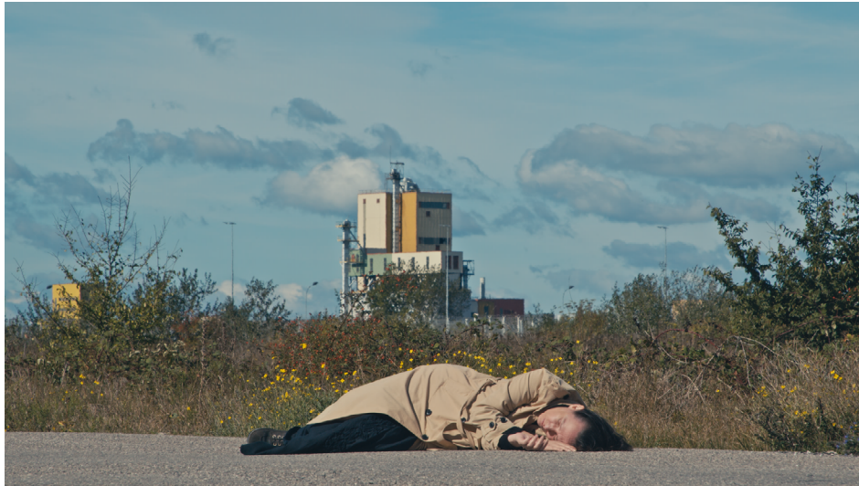
Le Film d'en finir ou pas , Frank Smith, 2023.