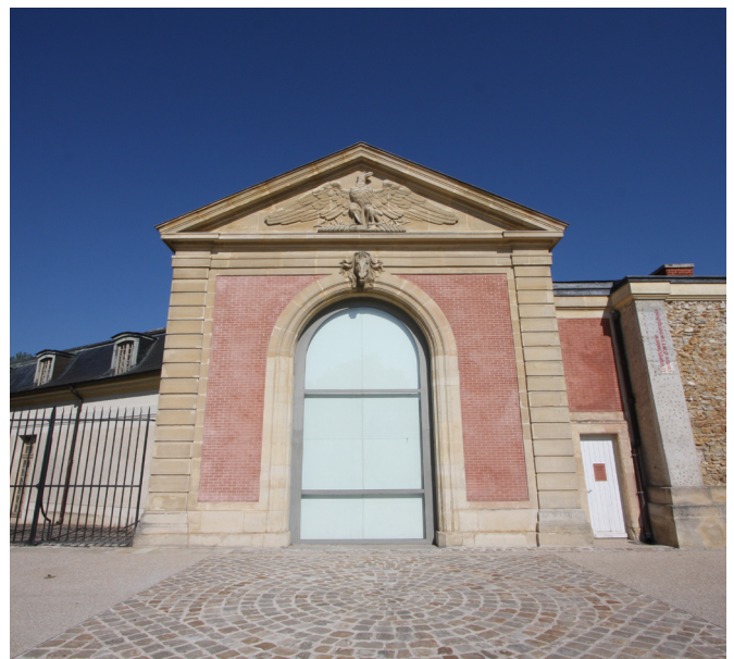
Vue du centre d'art depuis la Place des Manèges.

En 2024 La Maréchalerie écrit ses 20 ans de production artistique et de pédagogie interdisciplinaire. 2004-2024 c'est 54 expositions, 110 artistes exposé.e.s, 55 éditions produites. Ce sont aussi des artistes intervenants auprès des étudiants de l'ÉNSA avec les équipes pédagogiques, et au sein d'établissements scolaires du département des Yvelines et de Versailles en particulier, et des événements accessibles à tous : débats, conférences, performances, visites et ateliers de création.