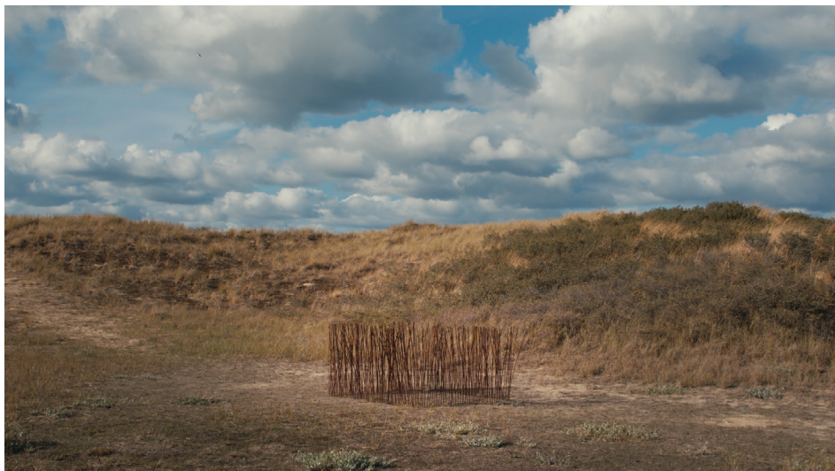
Le Film des objets , Frank Smith, 2023.