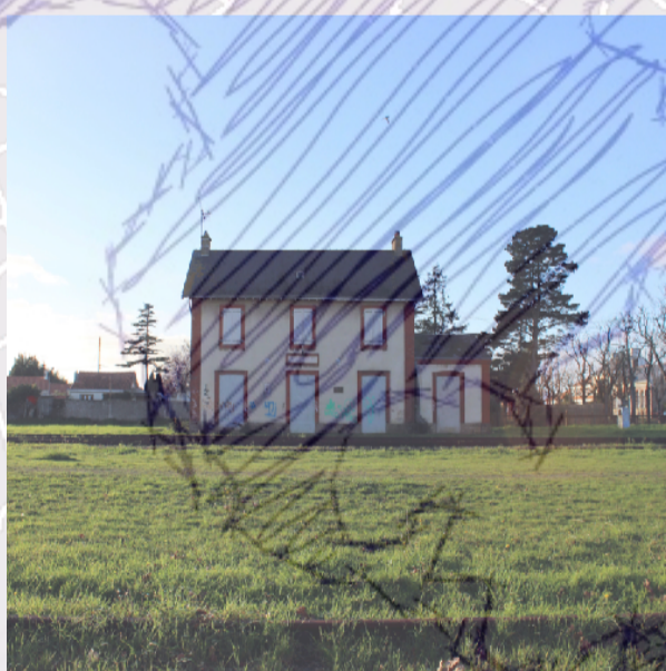
Estuaire de la Loire

l'isolement dans les territoires péri-métropolitains. La gare de Paimboeuf.