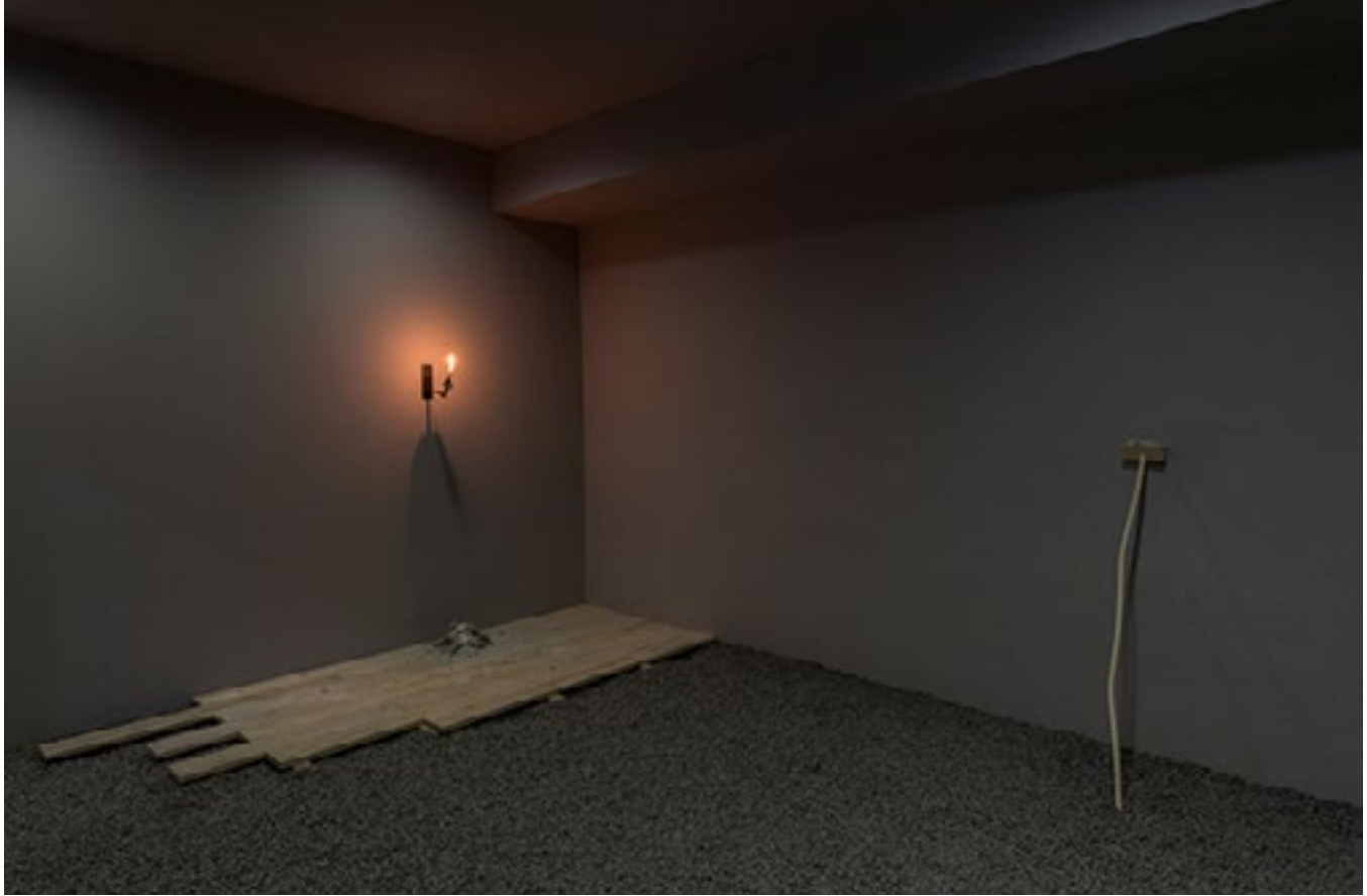
Stéphane Thidet, Dernière minute , 2017 Dimensions variables, bougeoir mural tordu, bougies, fragment de plancher