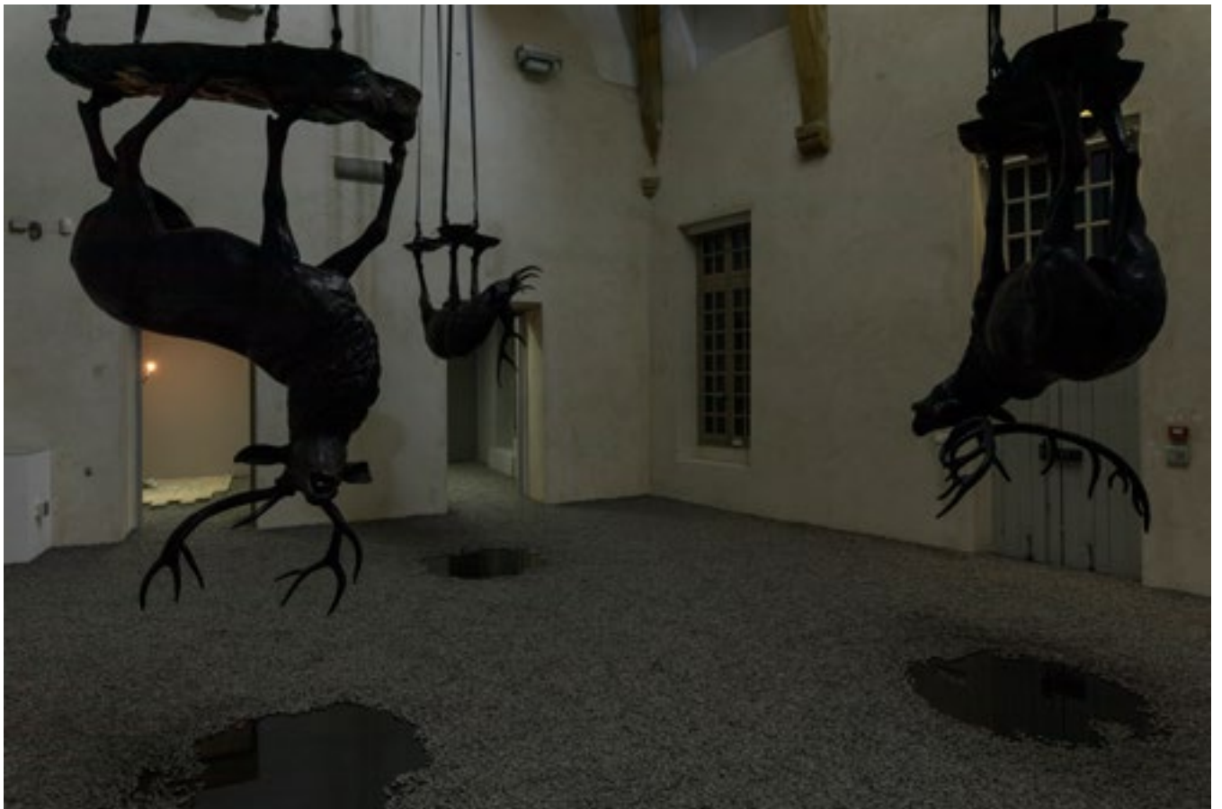
Stéphane Thidet, Orage , 2018 Dimensions variables, bronze, sangles, gravier, miroirs noirs