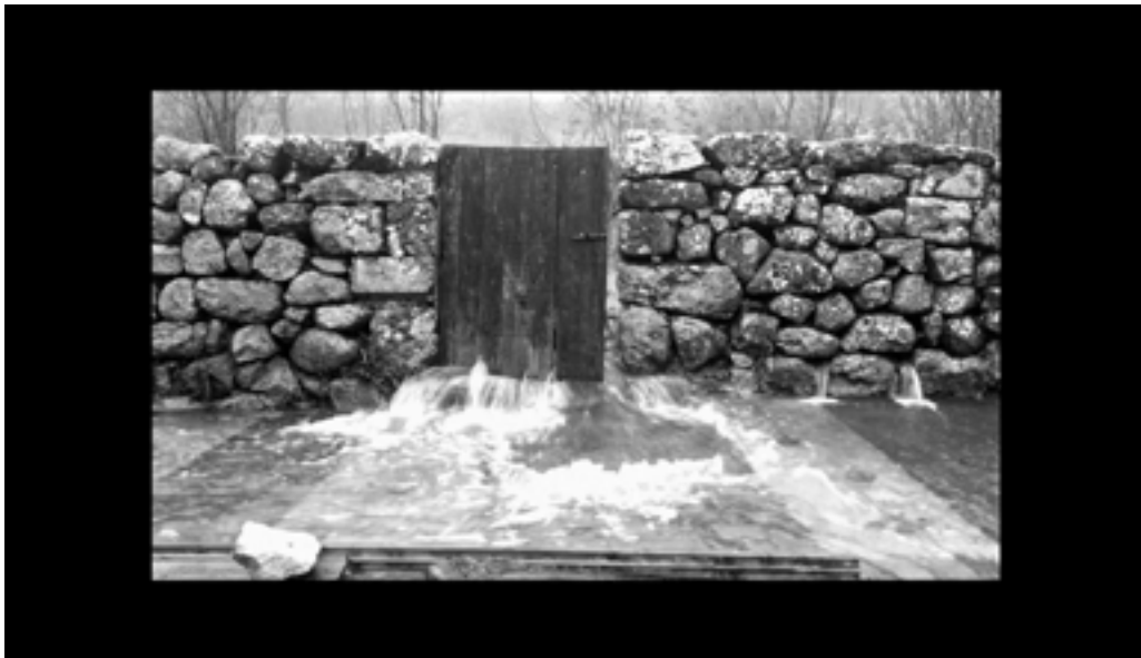
Liquid Thoughts , 2018 Dimensions variables Diptyque vidéo