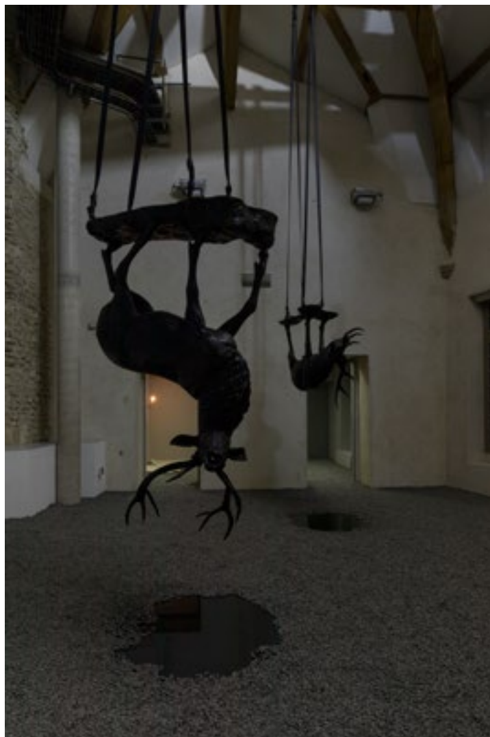
Vue de l'exposition " Orage" de Stéphane Thidet à La Maréchalerie, centre d'art contemporain / ENSA-V, Versailles 2018