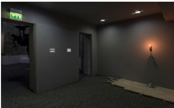
Stéphane Thidet, Je ne suis pas toi , 2018 Osier, sapin, os de mammifère marin, encre de Chine