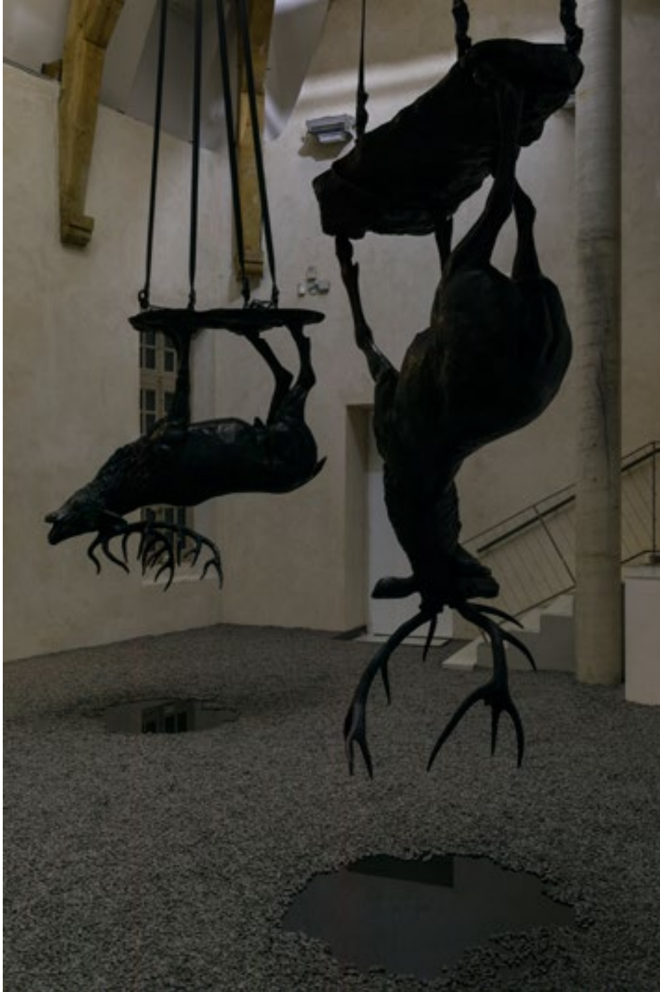
Vue de l'exposition " Orage" de Stéphane Thidet à La Maréchalerie, centre d'art contemporain / ENSA-V, Versailles 2018