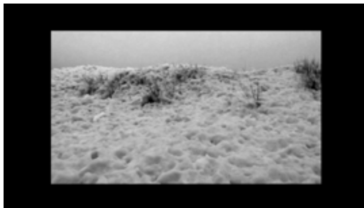
Liquid Thoughts , 2018 Dimensions variables Diptyque vidéo

www.stephanethidet.com www.alinevidal.com